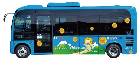
市川町 コミュニティバス